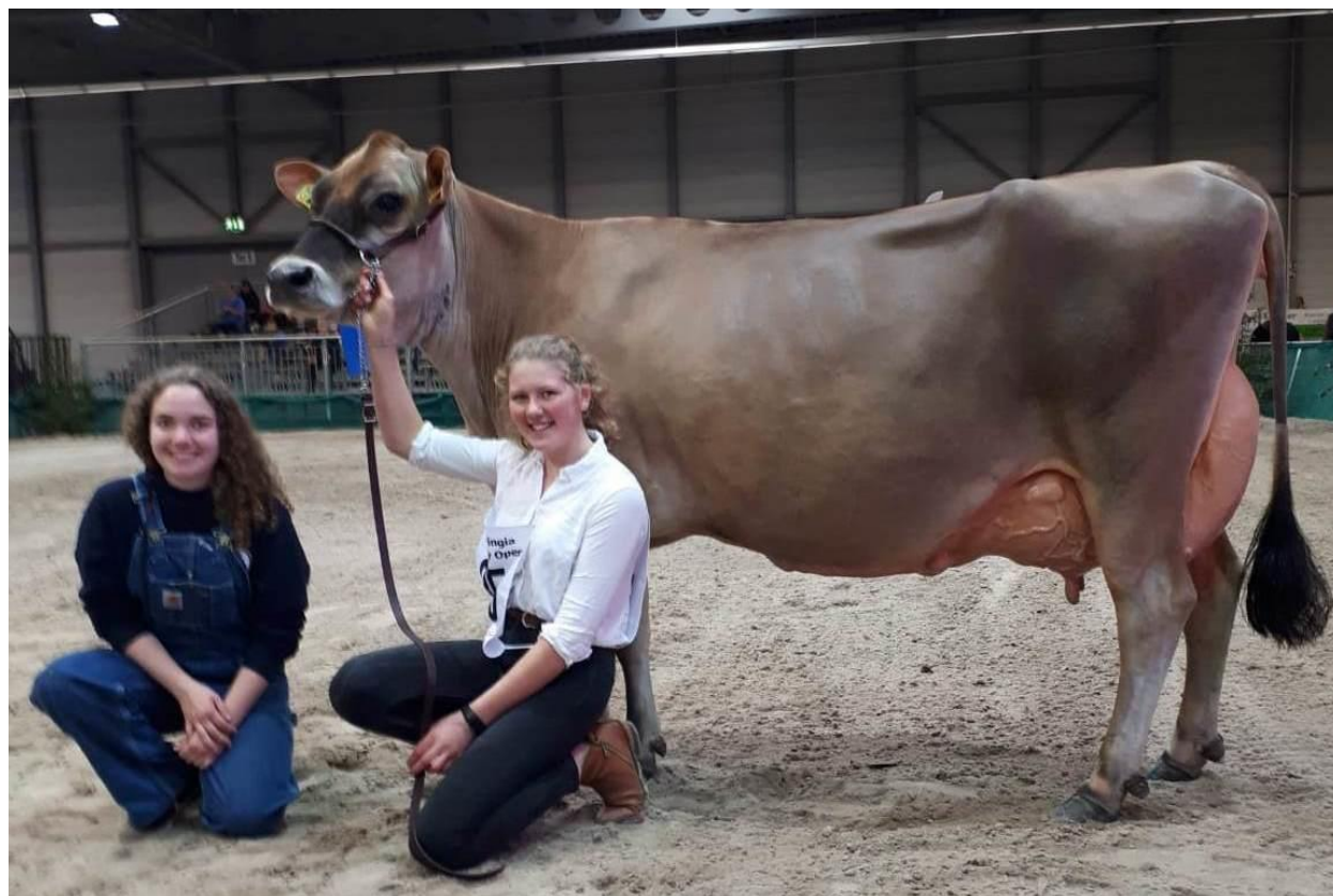
Jade EX-92 - Klassensiegerin Thuringia Jersey Open 2019 Mutter von Kat.-Nr. 1