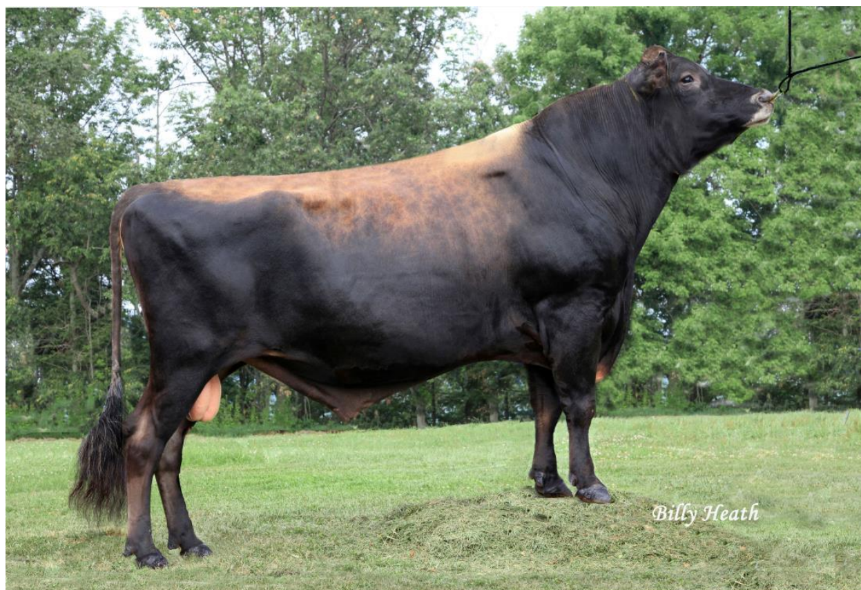
Tower Vue Prime TEQUILA - Vater von Kat.-Nr. 5